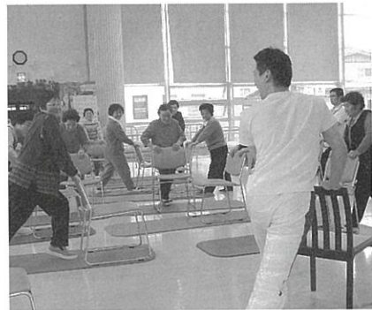
自宅でも簡単にできます

今後も、簡単な体操やレクリエーションなどを行い、楽しみながら筋力面、精神面で高齢者を応援していきます。