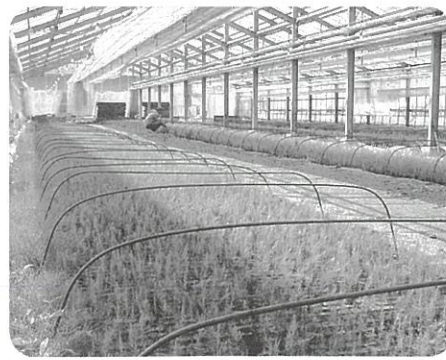
約7万本のアスパラガスの苗