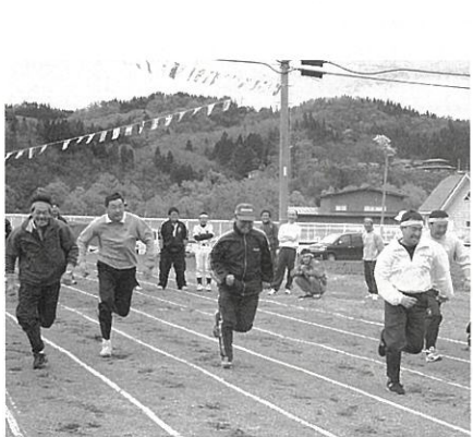
お父さん達も大ハッスル！

今年は雪が多かったためか草花の芽吹きが遅く、色とりどりの花が咲き乱れるとまではいかなかったものの、るり草やカタクリなどがかわいらしい花を咲かせ、散策中にカモシカが姿を現すなど、参加者を歓迎してくれました。