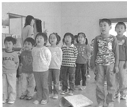
こいのぼりの歌でお祝い

5月5日のこどもの日を前に、町内の幼稚園や保育園では2日、こどもの日の集いを行いました。