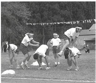
色別パフォーマンス