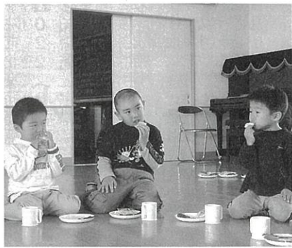
かしわ餅で元気モリモリ！

米田保育園では、米田小学校の1、2年生と先生方が来園し、それぞれ歌やお遊ぎを披露しました。また、藤里幼稚園では、ゲームやフォークダンスをしてこどもの日をお祝いしました。