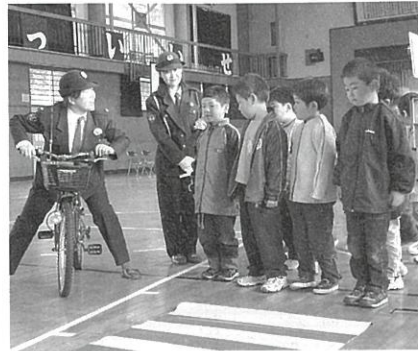
信号が青でも気をつけて！

石川駐在所長より「信号機が青だから渡るのではなく、青信号でも必ず左右の安全を確認してから渡りましょう」と指導を受けると、児童たちは「交通ルールを守るように心がけます」と交通安全を誓い合いました。