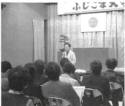
知って防ごう悪質商法