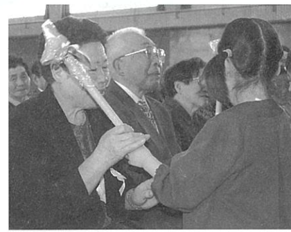
園児からのプレゼントにっこり

5月10日、藤里町総合体育館において、平成17年度藤里町敬老式が挙行され、各地区から620名余が式典に出席しました。今年めでたく敬老式を迎えられた方々は1,192名で、今年度初めて敬老を迎えられた方々(昭和9年4月2日から昭和10年4月1日までに生まれた方)が76名、数えて80歳の「傘寿」(大正15年と昭和元年生まれ)が74名、88歳の「米寿」(大正7年生まれ)が28名となっています。