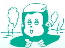
ほくは藤里町の マスコットキャラクター ユッター です。

毎年この時期になると藤駒岳に姿を現す駒の形。それを見るたびに思い出すのが、たしか私が小学校低学年だったときのこと▼当時、担任だった先生が、クラスのみんなを外に連れ出し、校庭から見える藤駒岳を指差して「お馬の形が分かりますか?」と聞きました。私にはどこの馬の形に見えるのかさっぱりわかりませんでした。みんなが「はい!」と手をあげるのでも私もつい、手を伸ばしてしまいました。(先生、嘘ついてごめんね)▼月日は過ぎ、馬の形をはっきりと認識したのは最近のこと。そういえば昨年、レストハウス白神のママさんから「こっこ駒」がいるらしいという話を聞きましたが、馬の後ろ足あたりにピットリと寄り添う小さな馬がいるように見えるのは私だけでしょうか? (山)