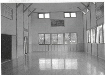
秋田杉の香り漂う明るい室内