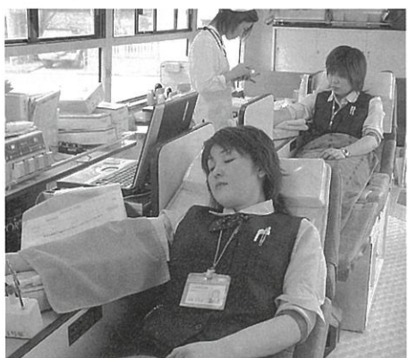
ご協力ありがとうございます