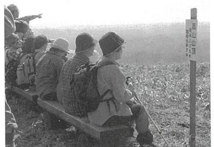
雄大な景観に感動

今年は雪が多かったためか草花の芽吹きが遅く、色とりどりの花が咲き乱れるとまではいかなかったものの、るり草やカタクリなどがかわいらしい花を咲かせ、散策中にカモシカが姿を現すなど、参加者を歓迎してくれました。