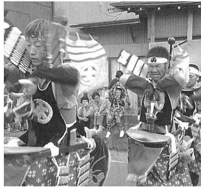
迫力あふれる駒踊り