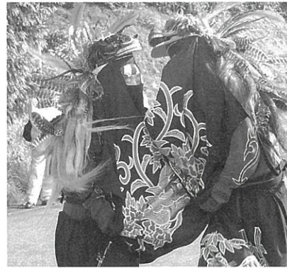
軽快な動きで見物客を魅了