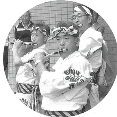
笛の音色に血が騒ぎだす