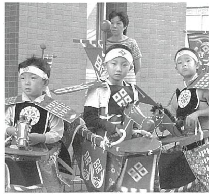
若駒にたくさんの声援が