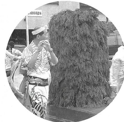
十数年ぶりにお目見えしたスギの門