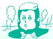
ほくは藤里町の マスコットキャラクター ユッター です。

8月下旬から9月上旬にかけて、台風15号、16号、18号と3つもの台風が秋田県内を通り、各地に大きなつめ跡を残していきました。藤里町でも民家の屋根がはがれるなどの被害がでたようです。一日も早い復旧をお祈りいたします。▼台風18号の影響で雨、風が強かった9月8日は、駒踊りが中止になるのでは?とヒヤヒヤ(広報のページに穴ができる...)でした。午後になると太陽が顔を出すまでに回復しましたが、風雨の中を駆けじと踊っていた上若、志茂若のみなさん、本当にお疲れさまでした▼スポーツの秋です。どの地区の運動会も、アイデアあふれる競技にみんな大盛り上がりでした。某地区の運動会に参加させていたいただきましたが、後に軽い!筋肉痛にみまわれ日頃の運動不足を痛感させられました(山)