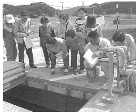
放流水と汚泥に分かれます

くりをし、教育にしても農業にしても藤里町らしい地域づくりを目指してがんばってほしい」と官民一体となった行財政への取組みを期待した県の見解が示されました。 下水道をもっと身近に 藤里浄化センター見学会 9月12日、藤里浄化センター（大沢字豊田地内）の見学会が催され、約10名の地域住民が参加し、下水道に関する知識を深めました。