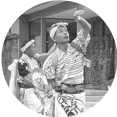
しなやかな手の動き(奴踊り)