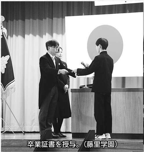
卒業証書を授与。(藤里学園)