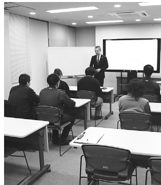
講師の説明を聞く参加者たち

今回の講座は、近年老後へ向けた資産形成として注目されている「NISA」と「iDeco」について学ぶ内容で、当日参加した人たちは、講師の説明を聞きながら制度についての理解を深めていました。