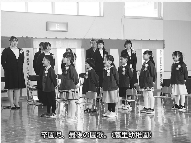
卒園児、最後の園歌。(藤里幼稚園)