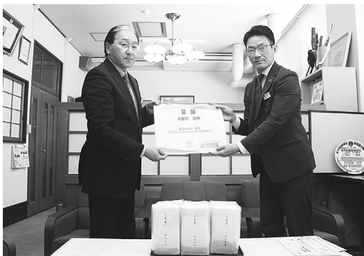
目録とタオルを受領

今回の寄付されたタオルは、町内の各施設に配布され、様々な事業に活用させていただきます。ご寄付ありがとうございました。