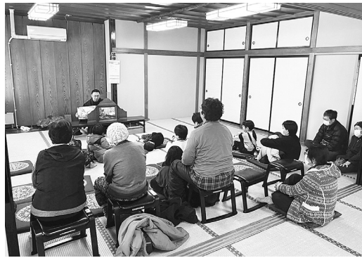
会員が藤里や秋田県内の昔話を紹介

会場では藤里町や秋田県内各地に伝わる昔話の紹介や、昔懐かしいおもちゃを使った遊びを体験できるコーナー、温かい豚汁などの無料提供も行われ、来場者は、楽しいひとときを過ごしていました。