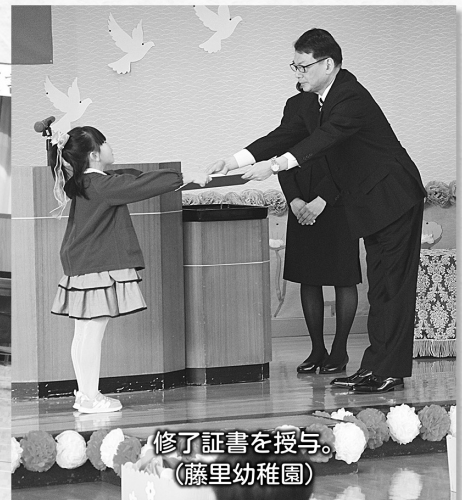
修了証書を授与。 (藤里幼稚園)