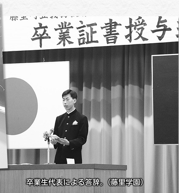
卒業生代表による答辞。(藤里学園)