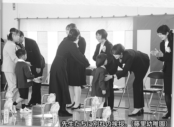
先生たちに別れの挨拶。(藤里幼稚園)