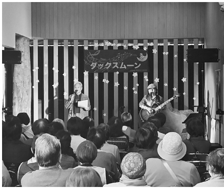
ダックスムーンの登場で大盛り上がりの会場

2月28日(土)、藤里町三世代交流館にて、心といのちを考える会主催のサロンコンサートが開催されました。