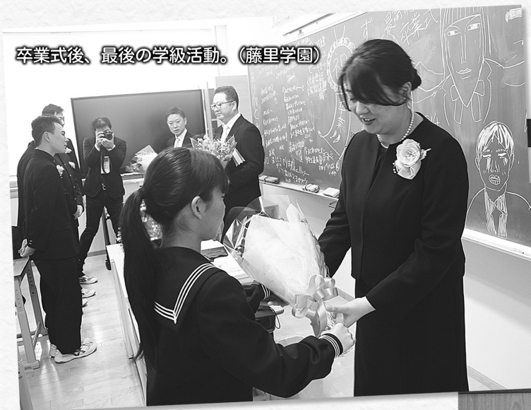
卒業式後、最後の学級活動。(藤里学園)