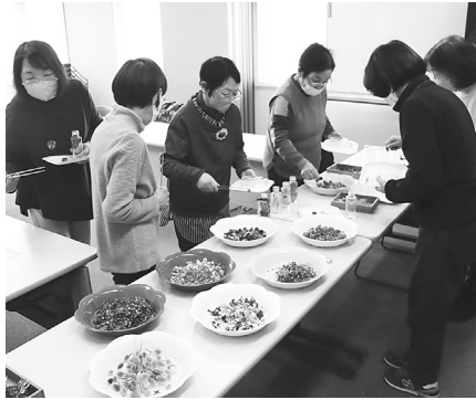
色とりどりの素材を選ぶ参加者

今回の講座のテーマとなった「ハーバリウム」は、ドライフラワーやプリザーブドフラワーを専用のオイルに浸してガラスに閉じ込めて作る雑貨で、当日参加した人たちは、講師の説明を聞きながら、思い思いの作品を仕上げていました。