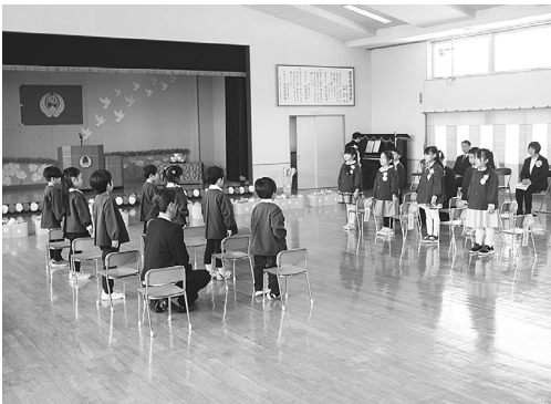
卒園児らによる呼びかけの場面

7名の卒園児たちは、園長先生から修了証書を授与されると、証書を高く掲げて立派に成長した姿を見せていました。