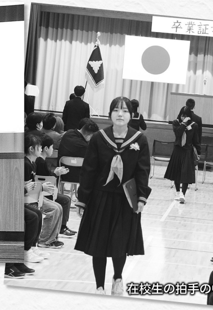
在校生の拍手の中、退場。(藤里学園)