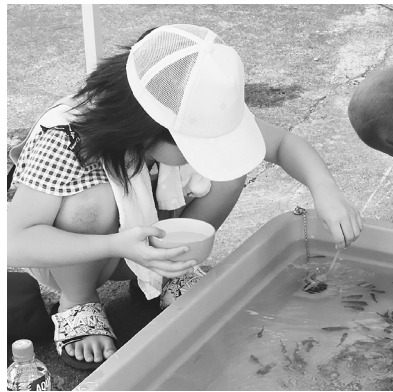
金魚すくいに夢中です