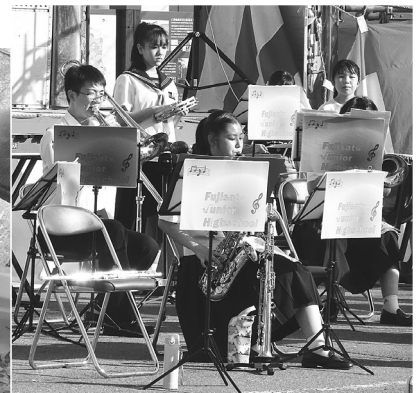
藤里学園吹奏楽部

総合同会にシャバ駄馬男さんを迎え、幼稚園児によるダンスから始まった歩行者天国は、藤里学園吹奏楽部の演奏、ラプトルコダイラのミニライブ、なまはげ太鼓の演奏、Yummyミュージックショーなど盛りだくさんの内容で、訪れた人たちはにぎやかな会場や屋台村など夏祭りを満喫していました。