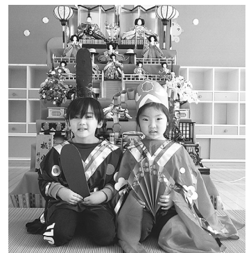
仲良く記念撮影（幼稚園）