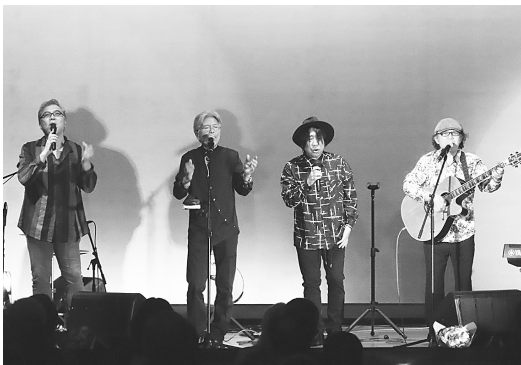
大興奮のステージ！

この日は、大館市を拠点に活動するダックスムーンが出演し「藤里物語」など多くの名曲を熱唱、そして軽快なトークで会場を盛り上げました。