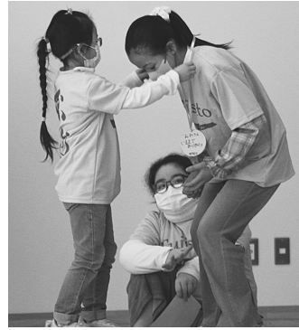
6年生へメダルを贈ります

この日は、卒業間近の6年生のために、在校生が一同となって会を主催しました。会の中では、これまで学校を牽引してくれた6年生へ、在校生が様々な贈り物とともに感謝の言葉を伝えていました。