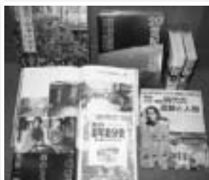
このほか「ライオン製品」やファンシー グッズの100年間での変遷を紹介した 本もあります。

町の図書室にない本でも お気軽にご相談ください。 県立図書館や県内の図書館、 北東北地区の図書館から 無料で借りることが出来ます。