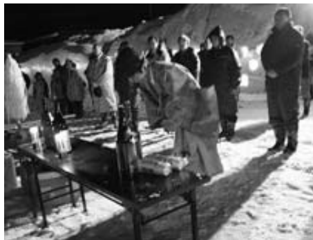
多くの方が訪れました

1月15日、藤琴地区活動推進協議会が主催するどんど焼きが、総合開発センターグラウンドにおいて行われました。グラウンド内に作られた雪灯ろうのろうそくの炎が幻想的な雰囲気漂わせる中、参加者らは、燃え盛る火柱で暖をとる、用意されていたお神酒や豚汁などをいただきながら、今年一年の無病息災や家内安全を祈っていました。