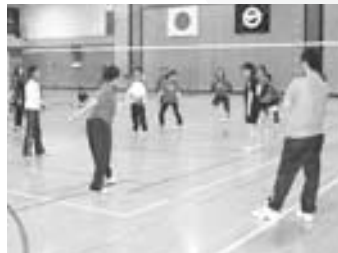
6 / 9 全町家庭婦人バレーボール 大会 2