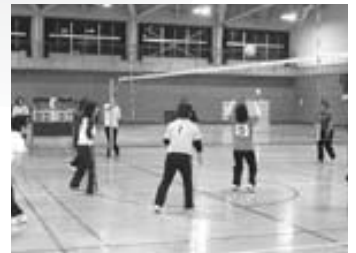
6 / 9 全町家庭婦人バレーボール 大会 1