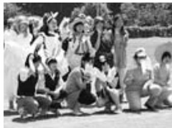
6 / 6 藤里中学校体育祭 2