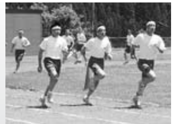
6 / 6 藤里中学校体育祭 1