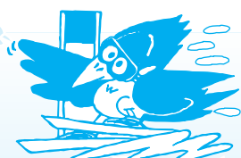
スキー場のキャラクター クマゲラの クッキーです。