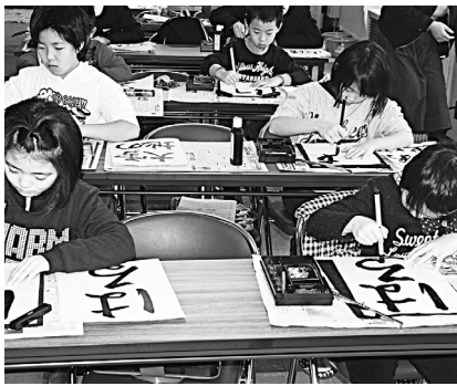
上手に書けたかな？

1月5日、総合開発センターにおいて、町公民館主催の第46回藤里町新春書き初め大会が開催され、小学生から一般町民まで、25名が参加しました。