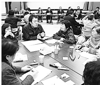
町にあったらいいモノ/コト/場所について語り合いました

続いて、町の人口予測や目標、それに対する取組などの情報が提示され「これから町に住み続けるために必要なこと」をテーマに、6つの班に分かれ意見交換を行いました。