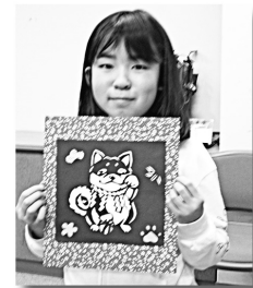
ご参加ありがとうございました。 またのお越しをお待ち しています!!

細かい部分の切り抜きに少々 手間取りながらも、全員がかわ いらしいお飾りを完成させるこ とができました!