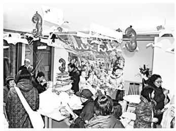
かもや堂で大好評配本中です！

今号の特集記事は、「師匠」をテーマに町を見つめなおした内容となっているほか、「聞き書き」や「女子のひとり飲み」、「朝野球名鑑」など盛りだくさんの内容となっています。