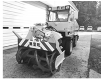
R2. 11月購入 小型ロータリー除雪車

除雪作業がスムーズに行えるようお互いに注意し合って、この冬を少しでも快適に過ごせるよう、各家庭や地域ぐるみでご協力をお願いします。